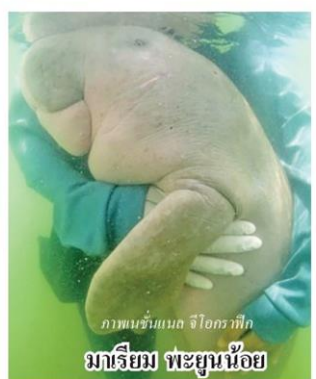
ภาพหน้าแม่ค จิโกรเท็ก มาริเยม พะยูมน้อย