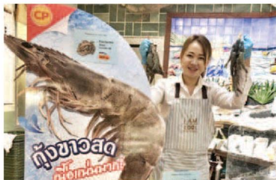
กุ้งสดพรีเมียม

ได้มาตรฐาน ไม่ใช้ยาปฏิชีวนะ เลือกขนาดได้ตามต้องการ หาซื้อได้แล้ววันนี้ ซีพี เฟรชมาร์ท ทุกสาขาทั่วประเทศ, แม็คโคร และ ซูเปอร์เซ็นเตอร์ รวมถึงตลาดสด ขนาดใหญ่ หรือใช้บริการจัดส่งฟรีถึงบ้าน ซีพี เฟรชมาร์ท ทีลีเวอร์ โทร.1788