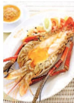
กุ้งแม่น้ำยักษ์เผา ลันอ้อยฟรีที่ร้าน อ.มัลลิการ์

●● พญ.ปิ่นชนิ ชาติบุรุษ ประธานมูลนิธิดวงใจใหม่ และนายกสมาคมศัลยแพทย์ทรวงอกแห่งประเทศไทย ชวนเชิญคนไทยร่วมส่งต่อใจดวงใหม่ให้เพื่อนมนุษย์ รับเทศกาลปีใหม่ผ่าน แก้วน้ำใจ แก้วกาแฟสไตล์ YETI สแตนเลส 2 ชั้น ใส่ได้ทั้งร้อนและเย็น, สี Matt White และ Matt Black พร้อมหูหิ้วผ้าแคนวาสให้เลือก 4 สี Crimson Red, Cobalt Blue, Moss Green และ Pecan Brown พิมพ์ลวดลายหัวใจ New Heart สื่อถึงความรักและห่วงใยที่ส่งต่อจากพลังน้ำใจของทุกคน