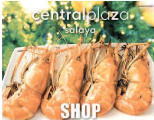
เทศกาล Shop Shrimp Chill

Shrimp Chill เทศกาลช้อป-ชิมกุ้งจังหวัดนครปฐมแหล่งผลิต กุ้งก้ามกรามที่โดดเด่นของประเทศไทย จำหน่ายกุ้งสด จากฟาร์มมาตรฐานในราคา ย่อมเยา รวมเมนูกุ้งก้ามกราม รับประกันความสด-ปลอดภัยและมี อาทิ กุ้งเผา กุ้งถึง ต้มยำกุ้ง กุ้งอบวุ้นเส้น กุ้งเผามันเยิ้ม กุ้งอบชีส ปากมันกุ้ง กุ้งอบเกลือ กุ้งลวกจิ้มซีฟู้ด กุ้งแช่น้ำปลา หัวมันกุ้งย่าง และอาหาร