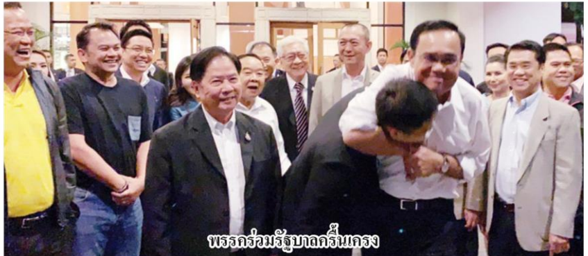
พรรคร่วมรัฐบาลกรีนเกรง

อีกประเด็นสะท้านทั้งในและนอกประเทศ คณะกรรมการวัดดูอันตราย มีมติวันที่ 22 ต.ค. ยกเลิกการใช้ 3 สารเคมี ทั้ง