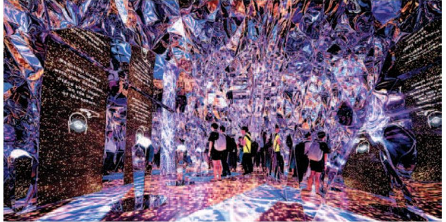
Beautiful Bangkok 2020: A Blossom of Happiness การแสดงแสงสีเสียงรับปี 2020

Thailand Countdown 2020 ณ ไอคอนสยาม ในคอนเซ็ปต์ 'มหัศจรรย์พร 7 ประการ' เป็นพลุทำจากข้าวเหนียวซึ่งมาจากธรรมชาติ ไม่ใช่ใช้วัสดุเคมี จึงเป็นพลุที่เป็นมิตรต่อสิ่งแวดล้อม คำนึงถึง เพื่อให้ทุกคนได้มีความสุขสนุกสนานอย่างปลอดภัย ขณะเดียวกัน เป็นพลุที่จุดในบริเวณที่สวยที่สุดในกรุงเทพฯ เพราะถือได้ว่าบริเวณนี้มีสภาพภูมิศาสตร์โค้งรับคล้ายเป็นสรวงสวรรค์ มีที่พักอาศัยหรูหราและโรงแรมระดับ 5 ดาว ตั้งอยู่บริเวณนี้มากมายหลายแห่ง เป็นการแสดงพลุเหนือสายน้ำที่มีขนาดรัศมีดอกไม้พลุที่สวยงามและระย้าทางยาวที่สุดในประเทศไทย ด้วยความยาวของระย้าทางการจุดพลุถึง