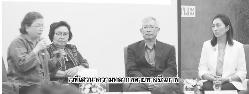
เวทีเสวนาความหลากหลายทางชีวภาพ

เป็นอิสระ เพื่อความโปร่งใสและความเป็นธรรม