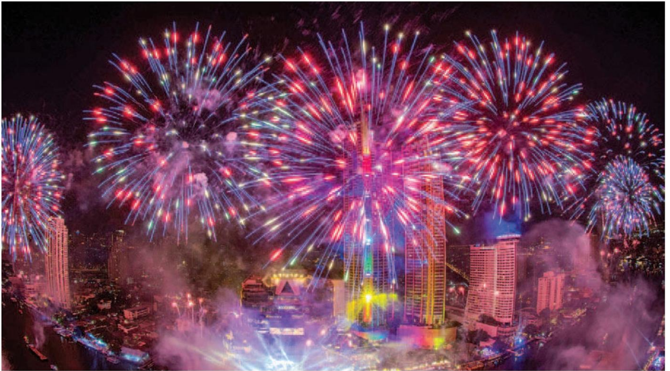
พลุ Amazing Thailand Countdown 2020 ที่ไอคอนสยาม (ภาพตัวอย่าง)

คอลัมน์: รมไม่ขายคา: นับถอยหลังสู่ปี 2020 แสงสีเสียงดอกไม้ และ พลุข้าวเหนียวไทย