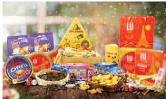
มอนเดลีซ่า ผลิตภัณฑ์ลิมิเตด อีดิชั่น