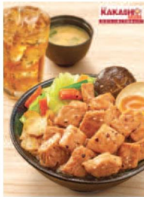
คาคาชิ, ข้าวหน้าลันหมู เปปinya

แปรรูป จาก 40 ร้าน ณ ลานกิจกรรม เซ็นทรัลพลาซ่า ศาลายา